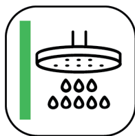
MUR DE DOUCHE