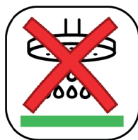
SOL DE DOUCHE