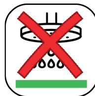
SOL DE DOUCHE